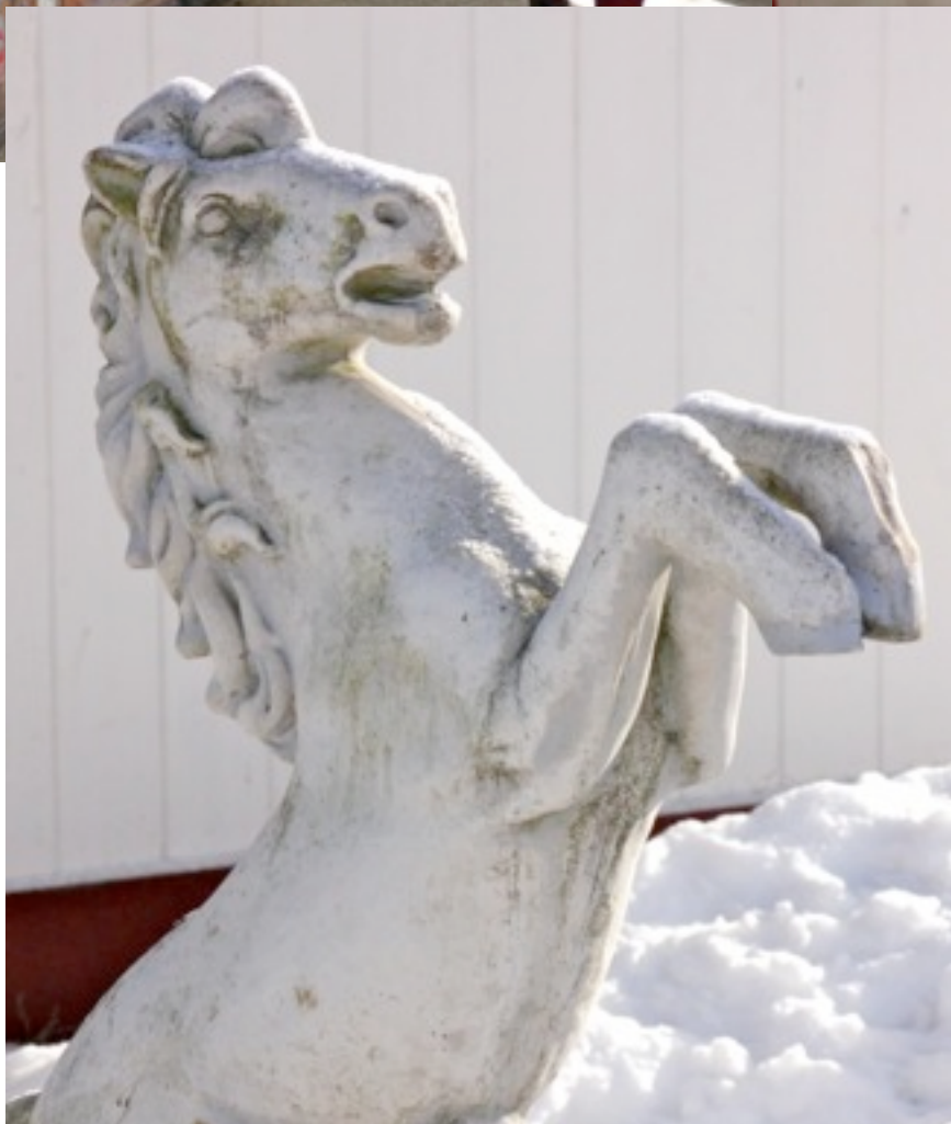
Utsmyckning vid skrittmaskinen.